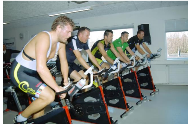
Der er 45 cykler i X-trainer studio

X-trainer Cup køres på indendørs cykler, hvor man kan se data som hastighed, distance og puls. Disse data vises på egen cykel computer, samt på storskærm. Alle cykler ses på storskærmen hvor placering, distance og afstand til nærmeste rytter, kan ses. Efter løbet udskrives resultatliste med gennemsnit watt og mellemtider.